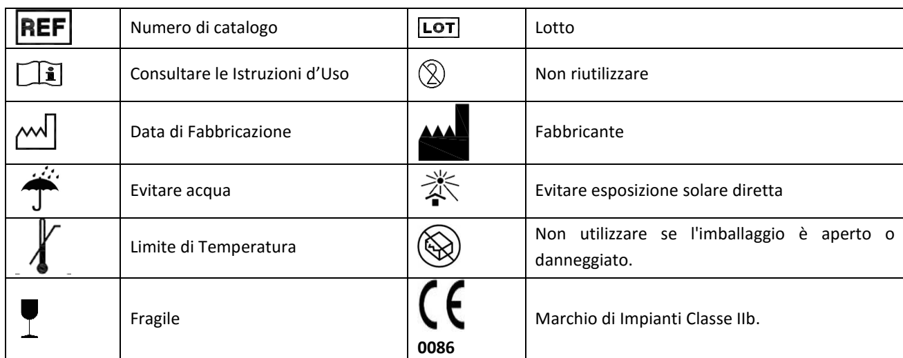
Tabella 1 – Simbologia utilizzata nell'etichettatura dei prodotti.